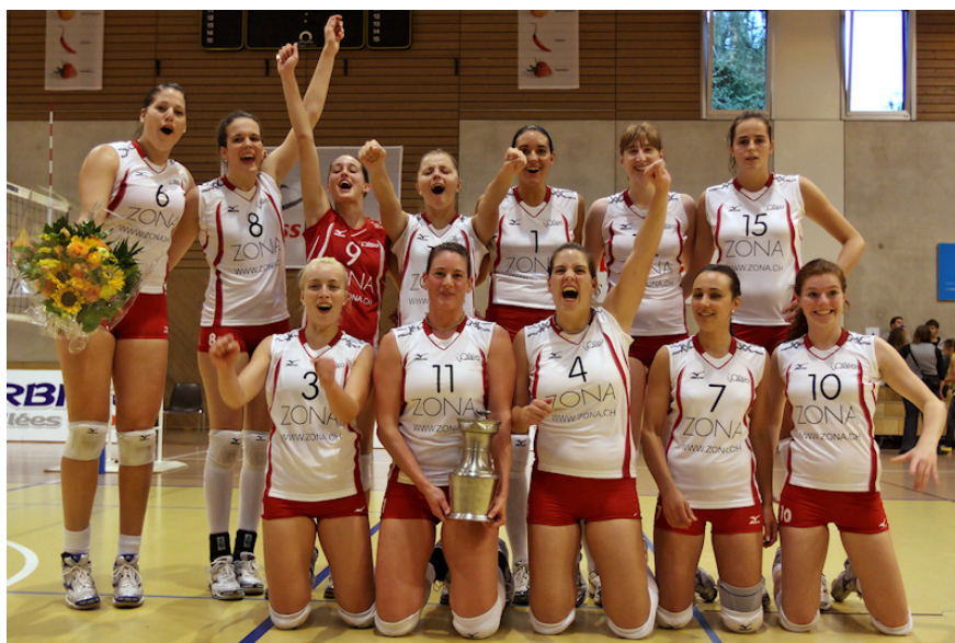
VBC Voléro Zürich

Die Gewinner des Supercups 2009 / Les vainqueurs de la Supercup 2009